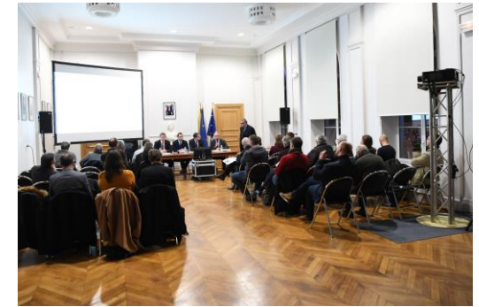
Réunion publique de concertation préalable à Bourbourg

GridLink entend s'engager de manière positive avec les collectivités locales, les entreprises, les groupes d'intérêt et tous les acteurs légaux et non statutaires concernant le développement, la construction et l'exploitation du projet d'interconnexion