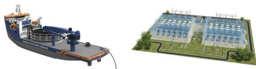
Navire de pose du câble Station de conversion